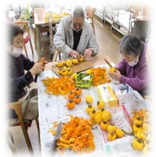
▲作品作りやみんなで運動!!