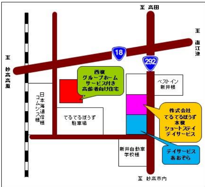
▲てるてるぼうず本棟と西棟の周辺案内図です。