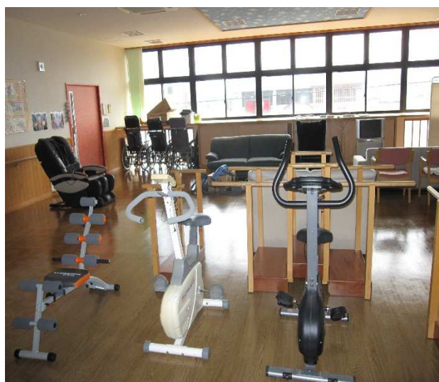
運動にマッサージ、お好きな物をどうぞ。

一日の過ごし方は十人十色。お泊りに来るのが楽しいショートステイを目指しています。