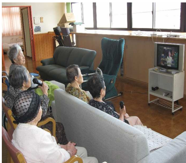
カラオケ好きな方々は大熱唱！