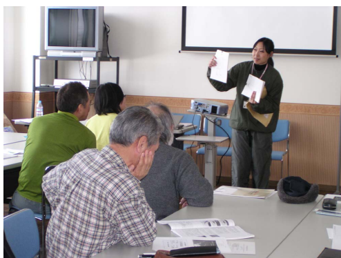
講習会の実施の様子

2月28日、3月2日の2日間で、環境省釧路自然環境事務所が主催する、釧路湿原パークボランティア向けの研修会が開かれ、レンジャーはその講師として関わりました。参加者は2日間あわせて31名でした。内容は、当会で開発した「タンチョウ・ティーチャーズガイド」のプログラムの体験と、参加者によるプログラムの実演を中心に行いました。