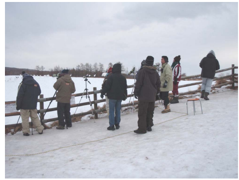
厳寒の中、採餌量調査を実施する参加者たち

2月15日から21日までの1週間、7名の大学生が訪れ、主に「給餌場におけるタンチョウの採餌量調査」に協力いただきました。20日に開かれた地域住民との懇親会では今回の活動報告もしてもらい、地域の方々にサンクチュアリの活動を知ってもらう機会にもなりました。参加者にとって今回の活動が、今後も自然保護に関わる活動を続けるきっかけになれば、さらに素晴らしいことだと思います。(0)