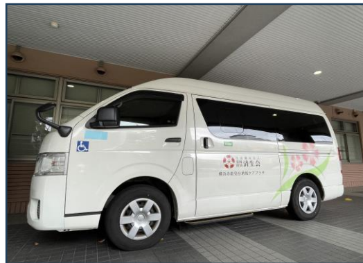
済生会のなでしこマークが目印です