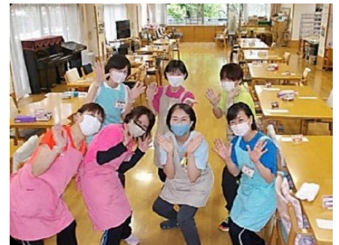
～笑顔いっぱい！ お待ちしております～デイルームにて