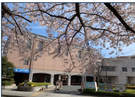
能見台地域ケアプラザ（外観）