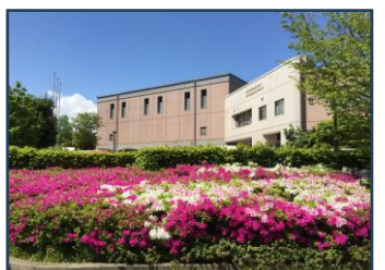
能見台地域ケアプラザ外観