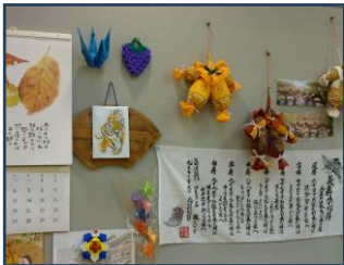
ご利用者様の作品展示