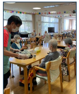
お茶をお配りします