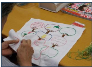
デイで刺し子を始めた方も