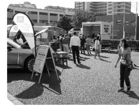
運転シミュレーターや起震車が大人気