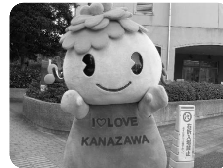
ぼたんちゃんもかけつけました

これからも地域に開かれ、利用しやすい施設となるよう努力してまいりますので、今後ともよろしくお願いたします。