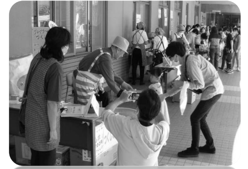
地域のボランティアさんのブースが大賑わいでした