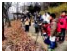
桜山貯水池のカモ観察

(下線は冬鳥) の17種が見られました。冬鳥の渡来が少ない中、今回はオカヨシガモの群れや、3羽並んで泳ぐオナガガモの雄がじっくり観察できました。