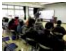
ふりかえりの時間