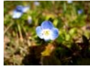
さむい中咲きはじめる オオイヌノフグリ